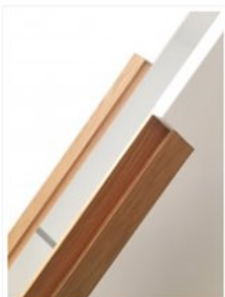
Tiradores diseñados en madera de roble en su color natural que contrastan de forma bella con las puertas y el interior lacado en blanco.

Se emplea con frecuencia para dar forma a carpinterías interiores, suelos, mobiliario, escaleras, estructuras a la vez que en construcción naval y tonelería. Cientos de posibilidades con los que Grupo GUBIA juega a la hora de proyectar cualquier espacio al que se le quiera dar estas connotaciones y estilo.