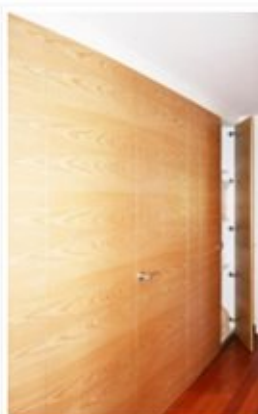
La continuidad del dibujo de la chapa

Grupo GUBIA, especialista en diseño y construcción de todo tipo de espacios en madera. diseña y fabrica