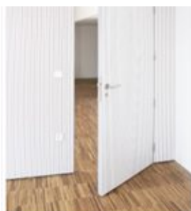
Puerta acústica de madera a medida terminada en tablero melamínico blanco fonoabsorbente.

puertas a medida –tanto de interior, como exterior- en este noble material, y lo hace con los más altos estándares de calidad y acabado.