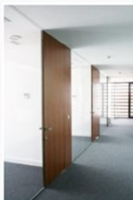
Mamparas y puertas a medida pivotantes en madera natural de mongoy barnizada.

Todos los materiales empleados en el proceso de fabricación de Grupo GUBIA tienen el aval de los sellos FSC y PEFC y los certificados requeridos según el tipo de edificación.