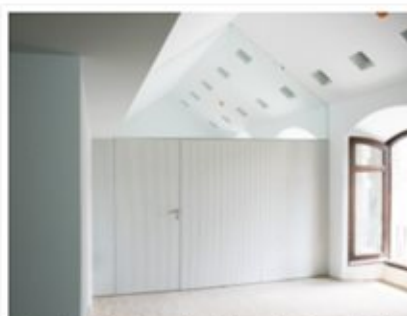
Puerta corredera de suelo a techo acabado estratificado blanco, guía superior oculta.

La sede del Ayuntamiento de Archidona (Málaga) es una muestra de su delicado trabajo. En ella, Grupo GUBIA ha realizado todo el trabajo de carpintería de madera, puertas de madera de suelo a techo con marcos macizos de aluminio que evitan el uso de tapajuntas, mamparas y puertas acústicas enrasadas formando paramentos continuos, techos de complejas formas para