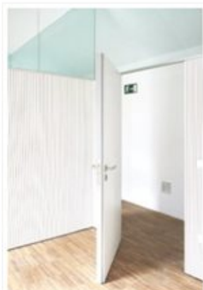
Puerta corredera de suelo a techo en madera natural de sucupira barnizada, guía superior oculta.

Los patinillos de acceso a las distintas instalaciones se cierran en cada planta con un sistema de puertas correderas lacadas en blanco que no dejan intuir lo que esconde en su interior. Estas puertas, que van de suelo a techo, se enrasan con un revestimiento idéntico de tal forma que quedan camufladas en él cuando están cerradas.