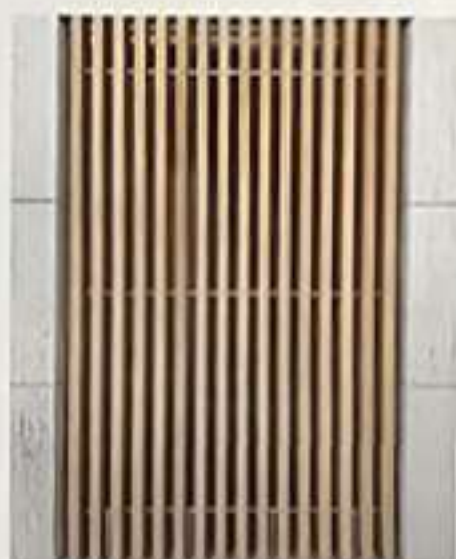
Fig. 7. Celosías y techos exteriores en la fachada del patio interior del inmueble © Grupo GUBIA.

Figs. 5 y 6. Imágenes cercanas en celosías exteriores, revestimientos y techos de terraza © Grupo GUBIA.