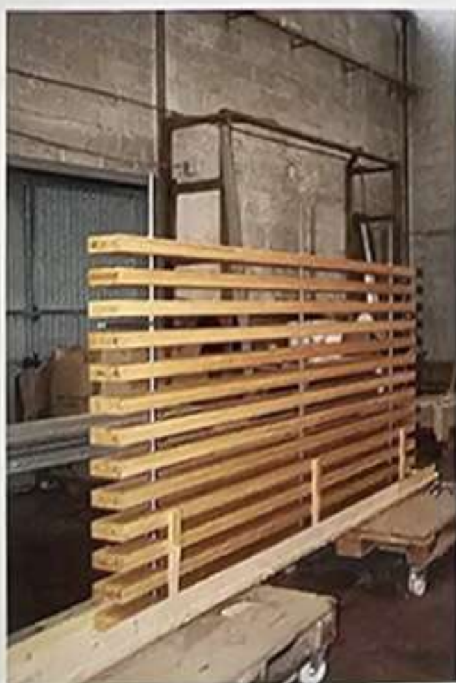
Fig. 1. Ensayos, maquetas y procesos de ensamblaje de celosías en taller.

Los cantos de las lamas se han suavizado mediante cepillado y las testas se han biselado para favorecer la escorrentía del agua, precaución necesaria en todo elemento de carpintería exterior. Las testas se tratan con resinas epoxídicas que sellan el material frente a la absorción de humedad y aseguran una vida útil del elemento.