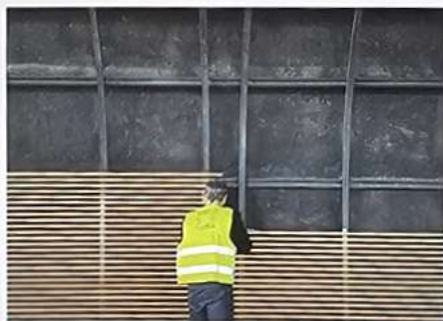
Figs. 10 y 11. Detalle de los elementos componentes de los capiteles de bambú en columnas © Grupo GUBIA.