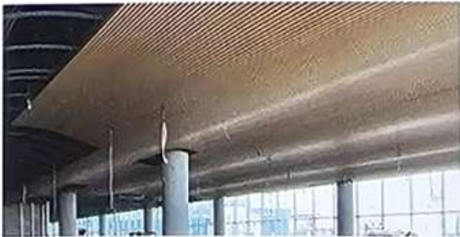
Fig. 1. Revestimiento de techo curvo de lamas de bambú y capiteles en la Sala Vip del Aeropuerto © Grupo GUBIA.