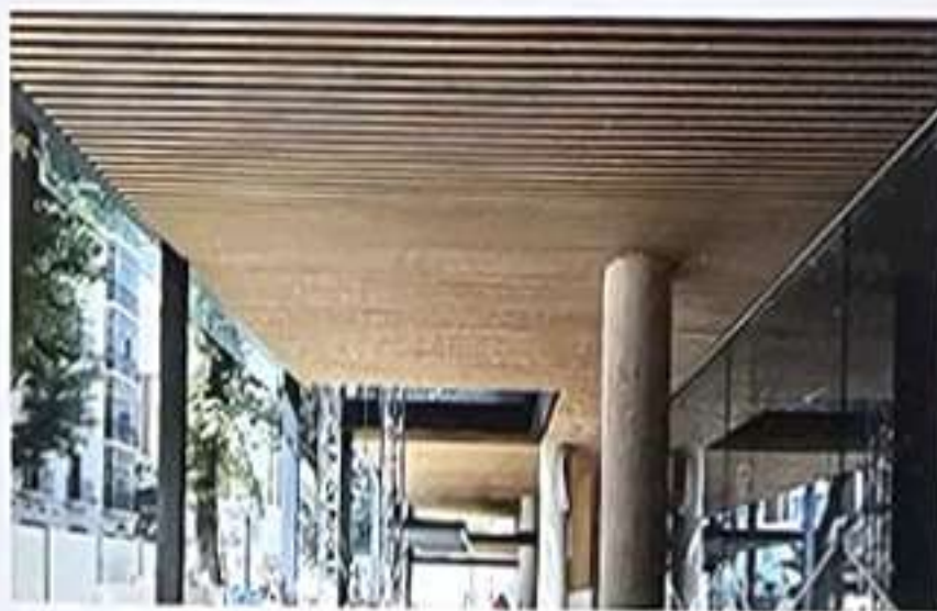
Fig. 3. Revestimientos de bambú color nogal y techos en zonas públicas en planta baja © Grupo GUBIA.