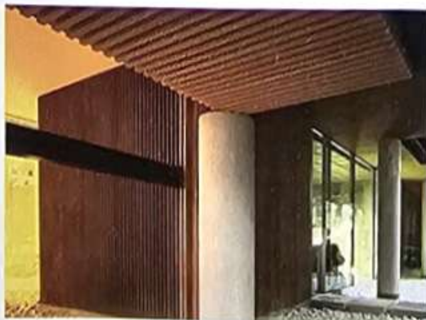
Fig. 4. Celosías y techos de bambú instalados en fachadas a calle y en patio © Grupo GUBIA.